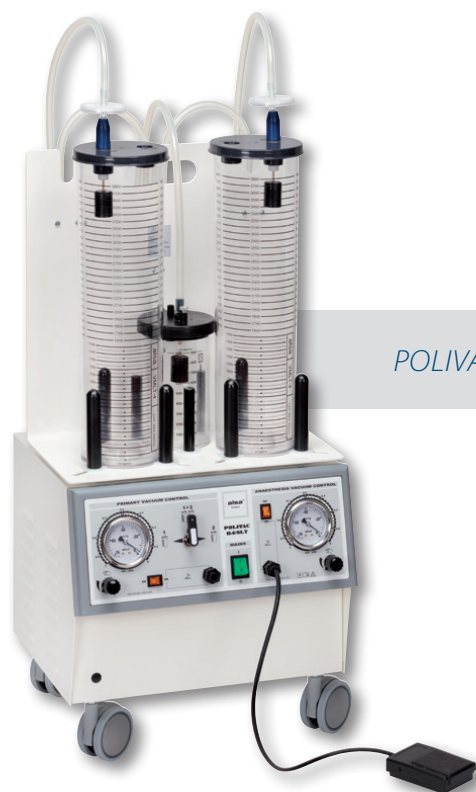
POLIVAC B4/SLT 50 E