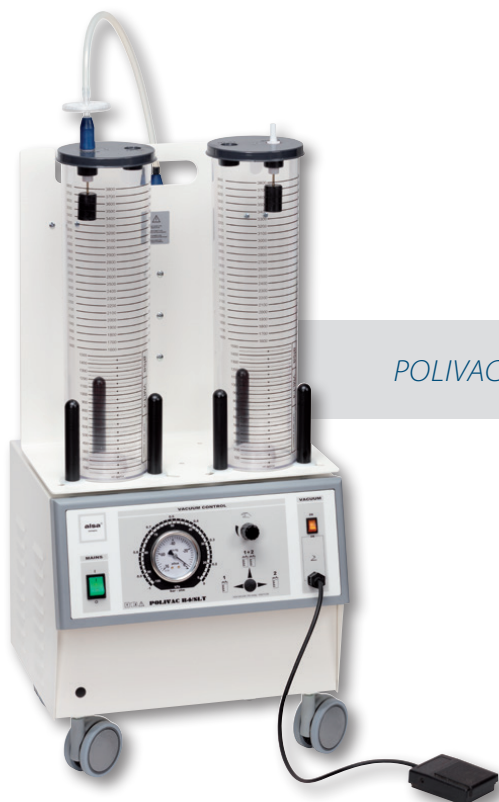
POLIVAC B4/SLT 30 2