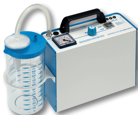
VORTECO AS-100 EMERGENCY (*)