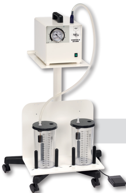
VORTEX-S AS-200 on H5 TROLLEY